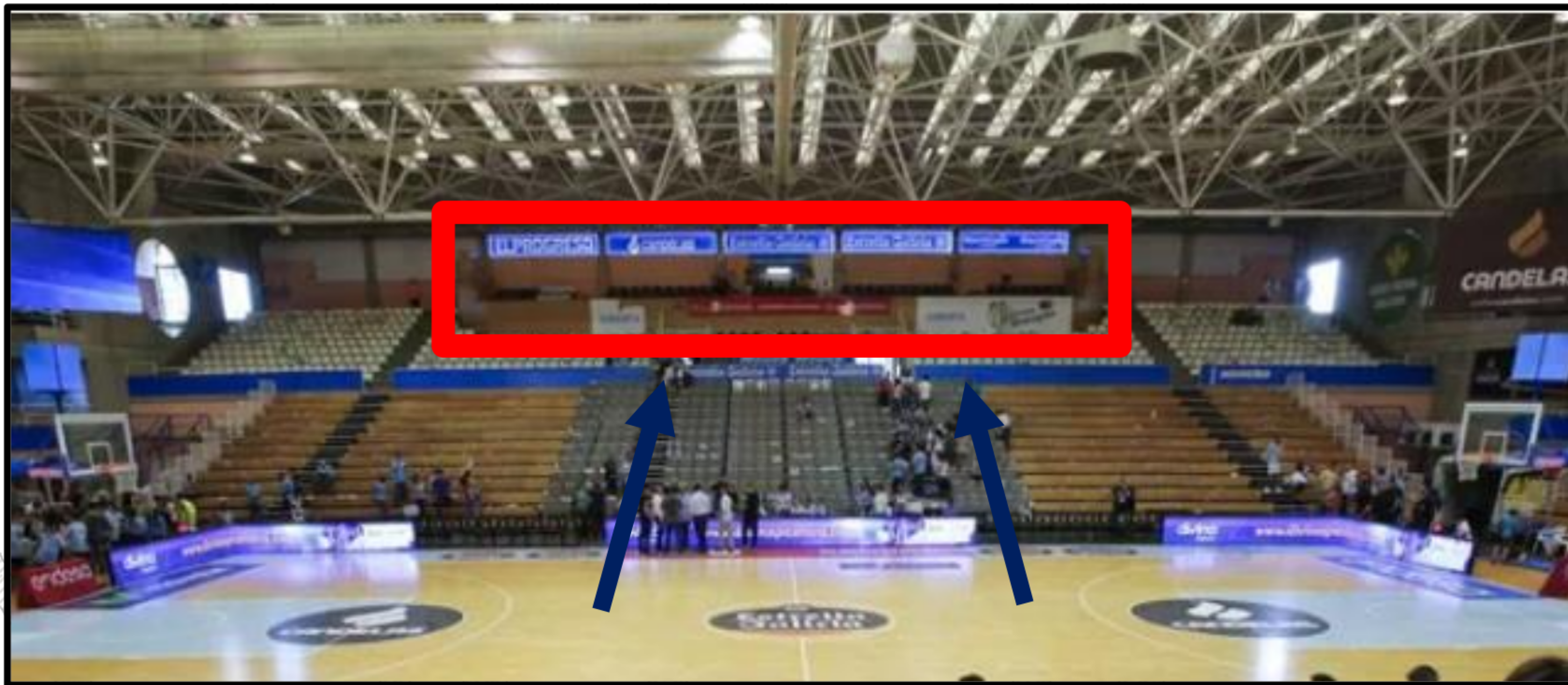
Imaxe 2. Palco Vip Fundación Breogán

Na Zona Vip disporedes de aperitivos de balde. Tan só teredes que aboar o importe das consumicións.