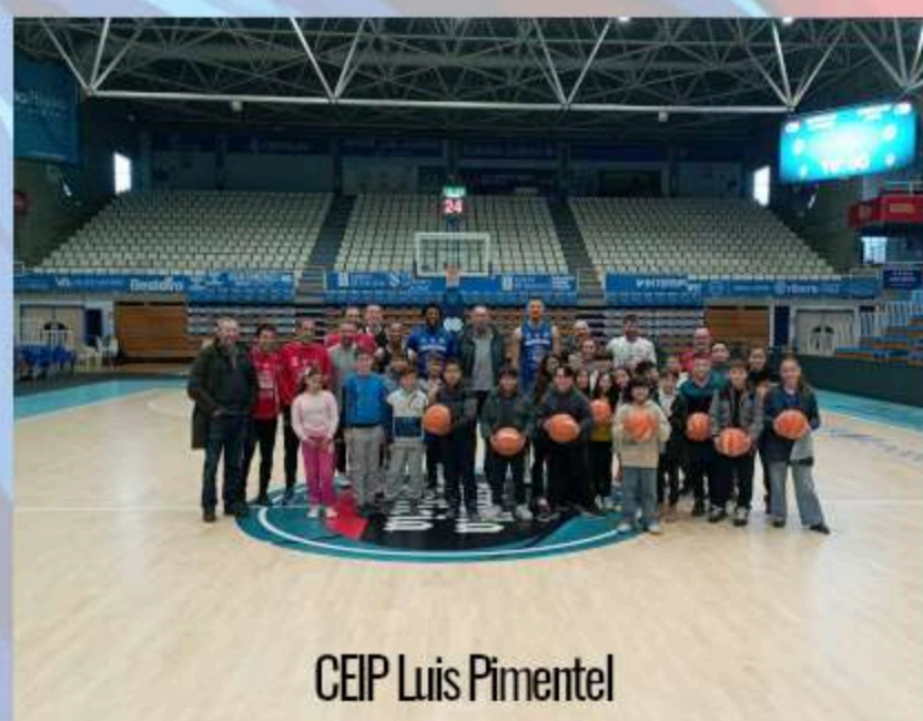
CEIP Luis Pimentel